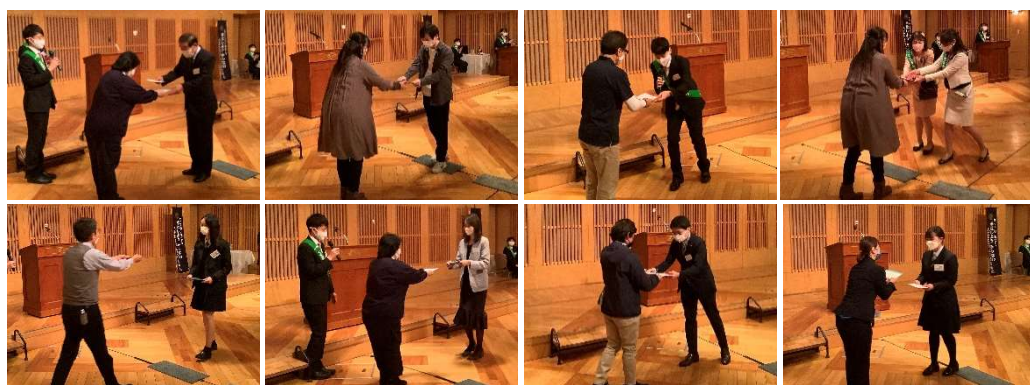
8組のマッチングが成立し、お互いの「マッチングカード」を手渡す。この日を境に、親睦を深めながら活発な活動が始まることを期待する

その後、活動内容に見合う団体・個人名を「マッチングカード」に記入し、そのカードをもとにマッチング結果を発表しました。成立した8組のうち、ボランティアを“して欲しい”団体としてエントリーした「埼玉福祉事業協会」と「氷川の杜づくり協議会」がマッチングするなど、お互いの活動趣旨に共感できたからこそこの交流が生まれ、想定を超えたマッチング結果が相次ぎました。