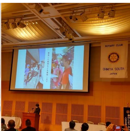
日頃知ることでできない各団体の活動に会場参加者は熱心に耳を傾けた