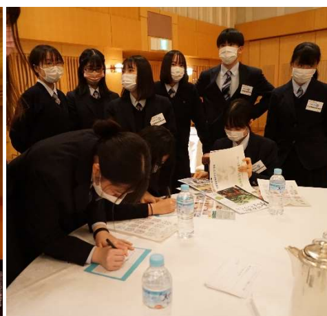
大宮開成高校インターアクトクラブ部員。コロナ禍の自粛から活動再開を期待して参加

9月9日より「ボランティア マッチング ACT」情報サイトの運営を開始し、イベントは、登録している27団体・個人のうち16団体等が登壇しました。「PR プレゼンテーション」により、あまり知られていない活動の意義を深く理解する場にもなりました。