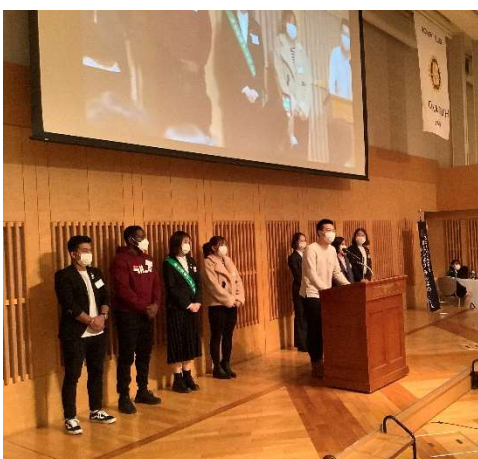
外国人留学生も個人でボランティア活動に参加したいと自身の想いを語った